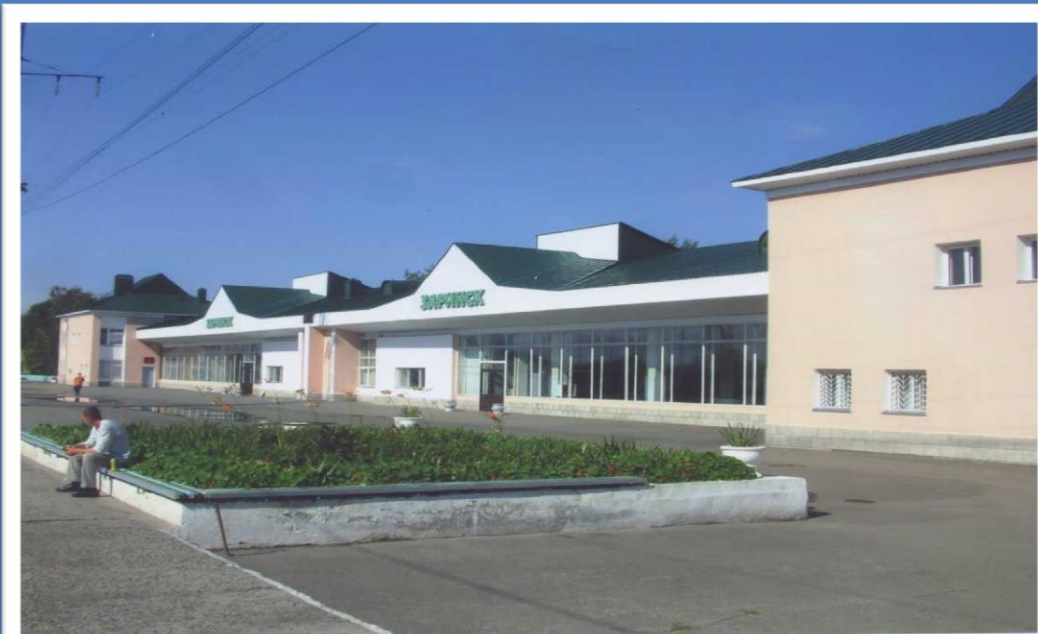
Здание железнодорожного вокзала ст. Заринская. Вид со стороны железнодорожных путей, 2006 год