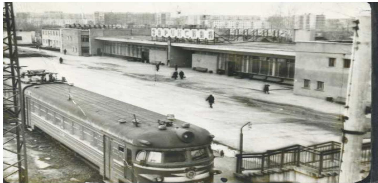
Внешний вид железнодорожного вокзала, построенного в 1981 году