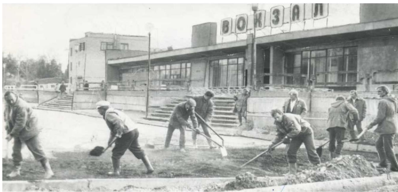
На благоустройстве привокзальной площади, 1989 год