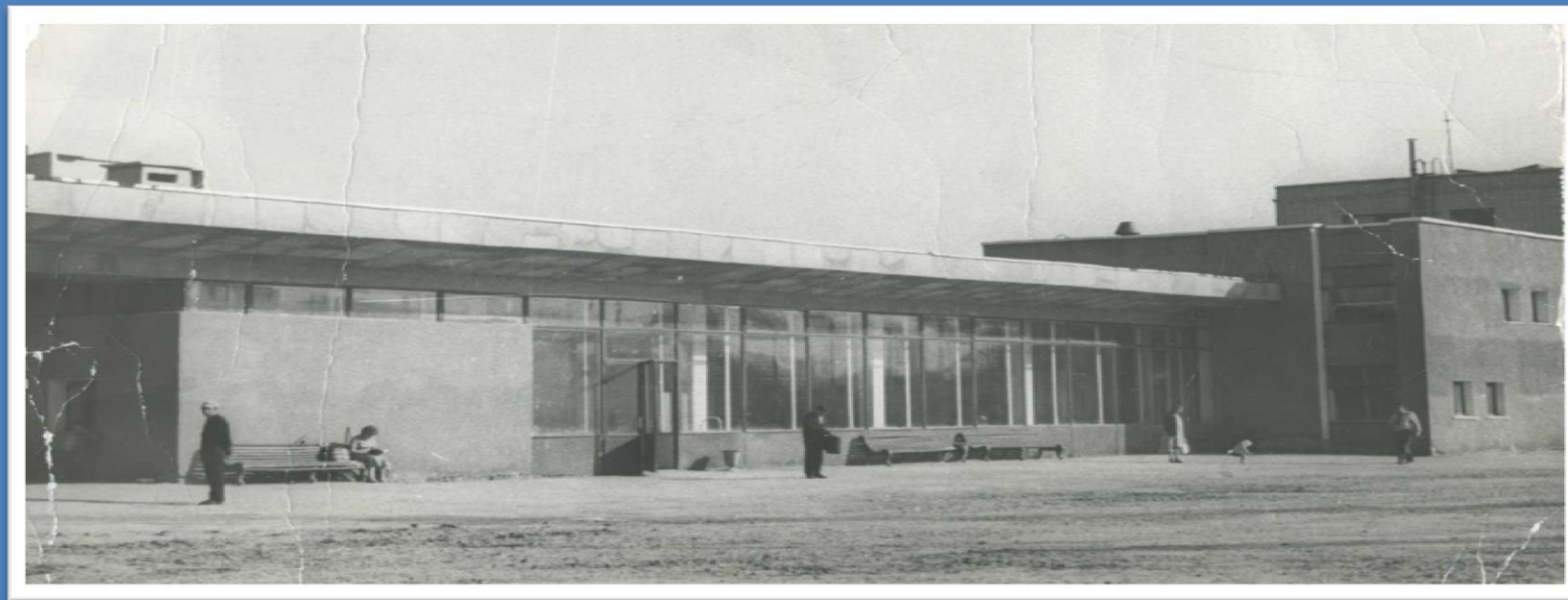
Фрагмент здания железнодорожного вокзала станция Заринская, 1986 год